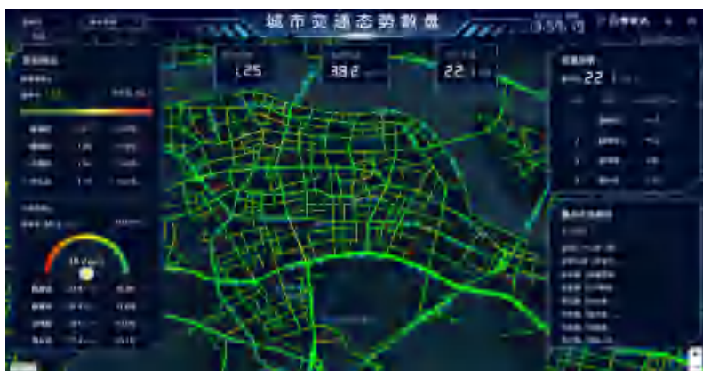
路段级车速实时监测

系统引入自有的移动互联网大数据，深度融合多方动态感知数据，洞察车速、车流、车流转向比等数据指标。系统为交管部门提供 交通路况态势感知、出行态势分析、车辆通勤规律分析、路口路段画像、车速监测 等场景化应用，实现对辖区交通情况的实时分析和监控，为交通管理决策提供可靠、准确的科学依据。