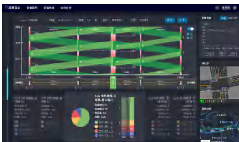
一键协调信控方案