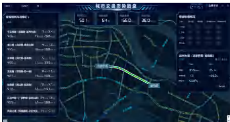
动态优化长期有效