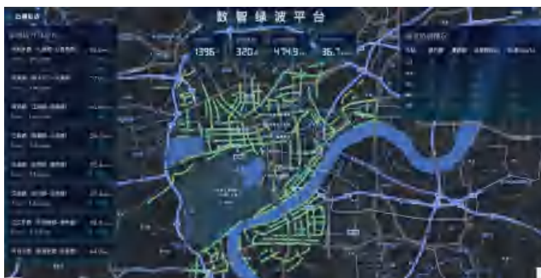
智能推荐绿波路段

系统在不增加感知设备投入的前提下，依托自有数据源，可提供 绿波推荐 、 绿波态势 、 路线管理 、 绿波设计 、 绿波监测 等模块功能。系统能助力交管部门构建感知、生成、预测、执行、监测的数治交管工作闭环，提升工作效率的 10倍 ，实现全域绿波建设，新建绿波道路通行效率提升超 20% 。