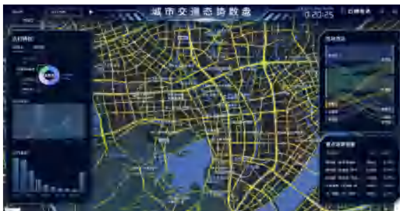
交通小区级出行分析